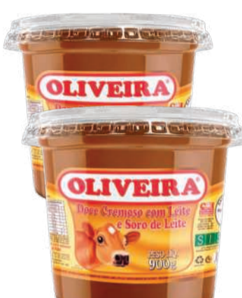
Doce de Leite Oliveira Pote 900g RS 15,90 un.