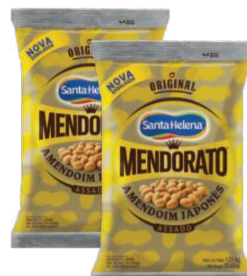
Amendoim Japonês Mendorato 1,01kg RS 24,90 un.