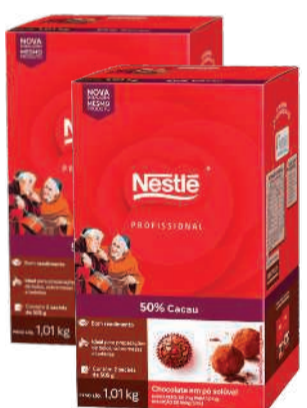
Chocolate em Pó Nestlé c/2 50% 1,01kg RS 69,90 un.