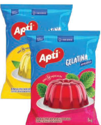
Gelatina em Pó APTI Morango/ Abacaxi 1kg RS 12,99 un.