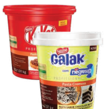
Pasta Cremosa Kit Kat/ Nestlé Galak 1,01kg RS 59,90 un.