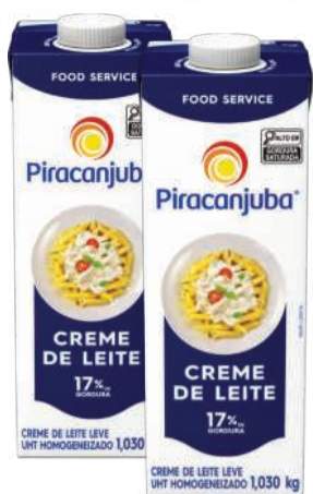
Creme de Leite Piracanjuba TP 1,03kg RS 15,49 un.