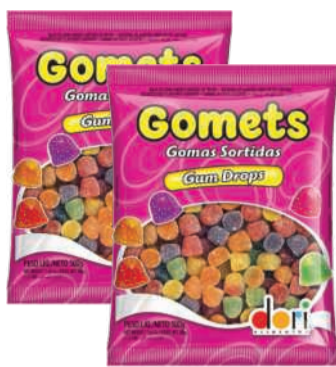
Bala de Goma Dori Gomets 500g RS 7,99 un.