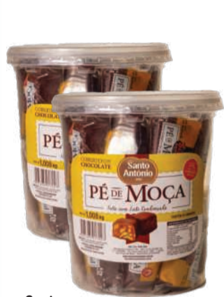
Doce Santo Antônio Pê de Moça Cobertura de Chocolate Pote 1,008kg RS 38,90 un.