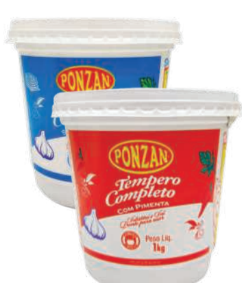
Tempero Ponzan 1kg Sabores RS 10,79 un.