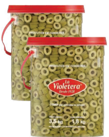
Azeitona Verde La Violetera Fatiada Balde 1,8kg RS 56,90 un.