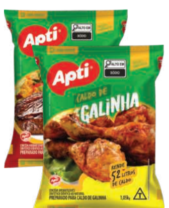
Caldo em Pó APTI Galinha/ Carne 1,05kg RS 8,49 un.