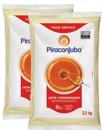
Leite Condensado Piracanjuba Semidesnatado 2,5kg RS 32,99 un.