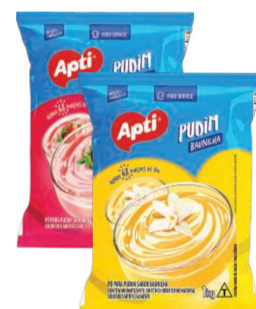
Pó para Pudim APTI Morango/ Baunilha/ Chocolate 1kg RS 7,69 un.