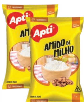
Amido de Milho APTI 1kg RS 9,89 un.