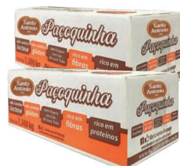
Paçoca Santo Antônio Caixa 1,5kg c/ 100 un. RS 24,90 un.