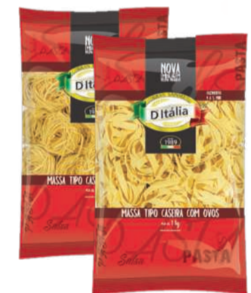
Massa Caseira D'Italia Pacote 1kg RS 13,98 un.