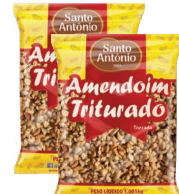
Amendoim Santo Antônio Triturado Torrado 1,005kg RS 16,90 un.