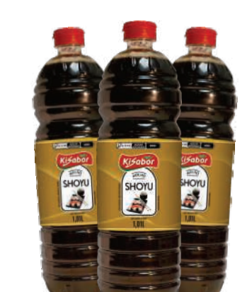
Molho Shoyu Kisabor 1,01 Litro RS 8,69 un.