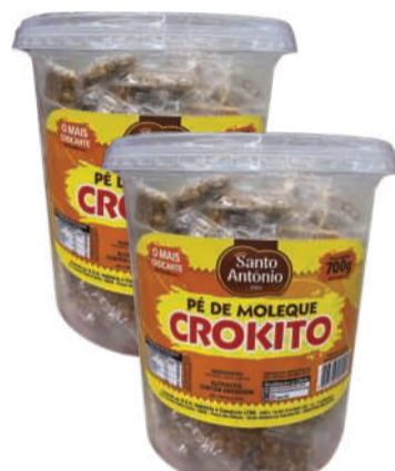
Pê de Moleque Crokito Santo Antônio Pote 700g RS 19,90 un.