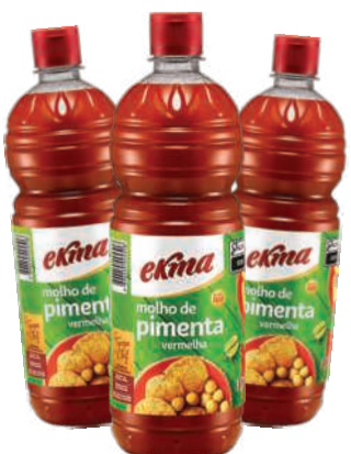
Molho de Pimenta Ekma 1,01 Litro RS 6,79 un.