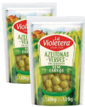
Azeitona Verde La Violetera s/ Carçoço Doy Pack 1,001kg RS 29,99 un.