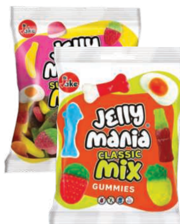
Bala de Gelatina Jake 1kg Sabores RS 38,90 un.