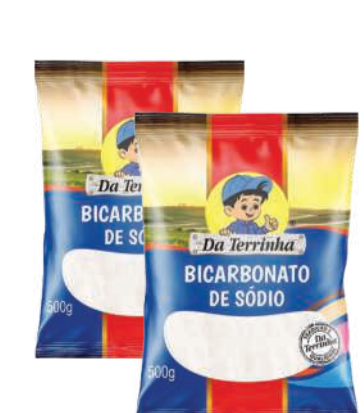
Bicarbonato de Sódio da Terrinha 500g RS 7,99 un.