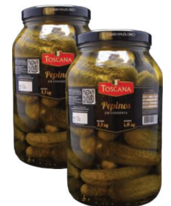
Pepino Toscana Conserva 1,8kg RS 46,90 un.